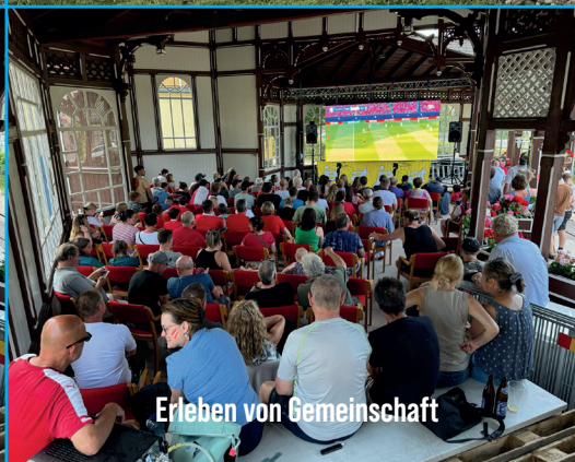
Erleben von Gemeinschaft