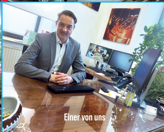
Einer von uns