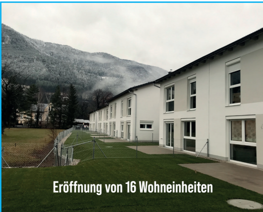
Eröffnung von 16 Wohneinheiten