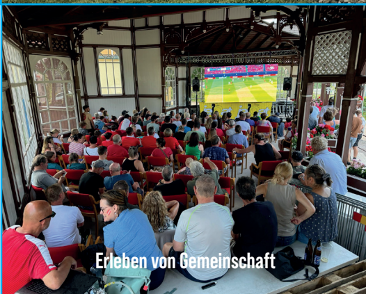
Erleben von Gemeinschaft