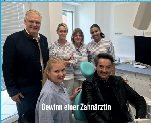
Gewinn einer Zahnärztin