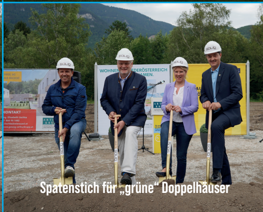
Spatenstich für „grüne“ Doppelhäuser