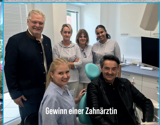
Gewinn einer Zahnärztin