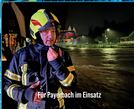
Für Payerbach im Einsatz