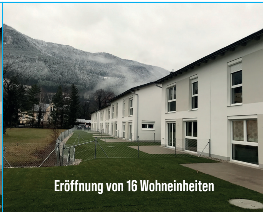
Eröffnung von 16 Wohneinheiten