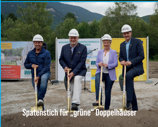
Spatenstich für „grüne“ Doppelhäuser