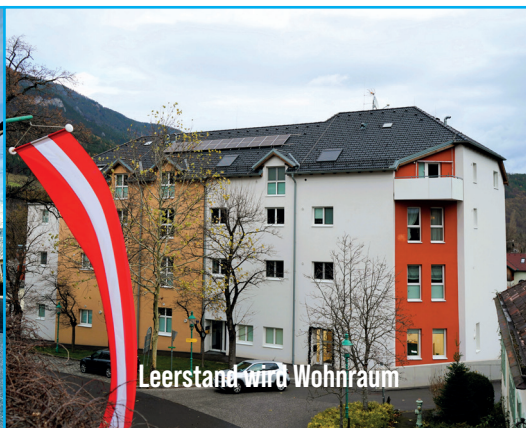
Leerstand wird Wohnraum