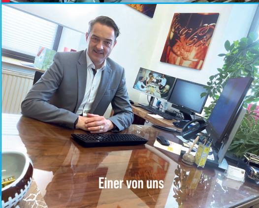
Einer von uns