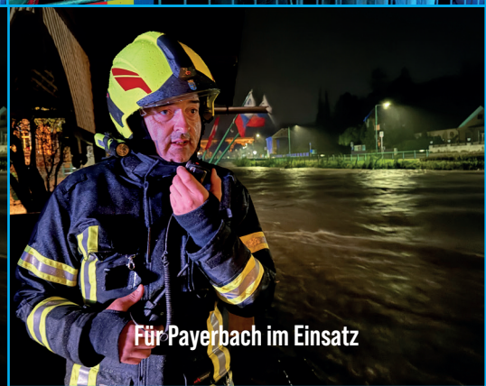
Für Payerbach im Einsatz